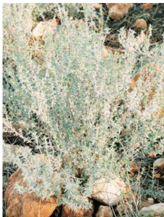
Thymus vulgaris (val: timonet, timó)

També es podrà trobar, amb prou freqüència, dos tipus de plantes aromàtiques. Una el romer, planta arbustiva aromàtica que pot arribar a mesurar fins a metre i mig, amb floració de color blau clar, rosa o blanquinosa, d'olor agradable, que es pot apreciar refregant -suaument- la planta entre les mans. Sol utilitzar-se en la cuina mediterrània, sobretot per a aromatitzar la "paella"; en cosmètica o en les famoses fregues amb alcohol de romer. Les seues flors són libades per les abelles per a elaborar la coneguda mel de romer, d'efectes balsàmics.