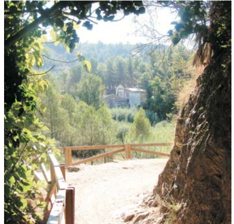
La Casa de la Llum (vista)

Una vegada conclou la visita al voltant de la Casa de la Llum es pot aprofitar la zona de picnic i fer un alto per a descansar i menjar alguna cosa, però abans un detall, a la dreta del camí i davant de la zona de recreació hi ha una senda, delimitada per pedres a un costat i a l'altre, que s'endinsa per la vessant de la muntanya i en el qual es poden observar unes marques formades per dues xicotetes traces paral·leles de color blanc i groc, i que també s'hauran vist al llarg de l'itinerari en més d'una ocasió, són les marques del PR-V78, (xicotet recorregut), el manteniment de les quals correspon al CEX (Centre Excursionista de Xàtiva) amb una longitud d'un poc més de 18 quilòmetres i 4 h i 30 min. de duració aproximada.