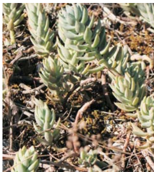
Sedum sedifforme (val: raim de pastor)

Altres dues plantes a destacar són l'ungla de gat, més coneguda com raim de pastor, formada per fulles carneses, comparteix espais amb romerars i timoners. En algunes zones, adobades amb sal i vinagre, solen prendre's com aperitiu. I els cresols que es troben, preferentment, en llocs amb un cert grau d'humitat. També són coneguts com frailillos o caputxins per la forma de les seues flors que assemblen al caputxó d'un frare; les seues fulles tenen forma de cor o fletxa i cal parar atenció atés que són un poc tòxiques.