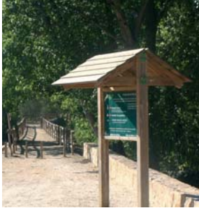
Eixida del paratge