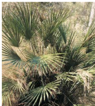
Chamaerops humilis (val: margalló)

En esta part del recorregut es pot observar amb major freqüència el fenoll, de flors grogues i reunides en forma d'umbrelas. Si es frega entre les mans desprén una certa aroma anisada, motiu pel qual en ocasions s'ha utilitzat com aromatizador.