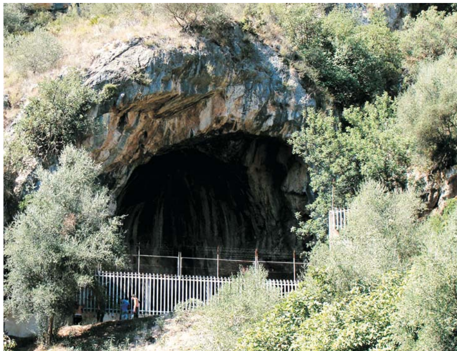
La Cova Negra