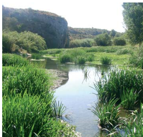
Vista vegetació fluvial

I si s'observa aigües amunt, es pot veure l'abundant vegetació aquàtica que apareix en aquestes tranquil·les aigües, com a exemple destacat tenim la Ludwigia grandiflora , arrelada davall l'aigua i amb una part aèria, que és la que veiem. És una planta exòtica provinent de Centre Amèrica i amb gran capacitat de colonització actualment aquesta planta està inclosa en el catàleg d'espècies exòtiques invasores de la Comunitat Valenciana.