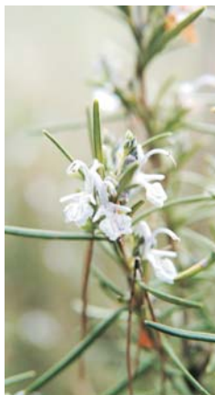
Rosmarinus officinalis (val: romer)