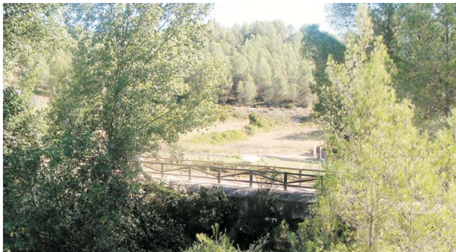
Panoràmica del pont-aqüeducte de l'inici de ruta

Transcorreguts uns 20 o 30 minuts, des que es va començar l'itinerari i en funció de les parades efectuades, s'haurà d'estar arribant a un dels assentaments prehistòrics més importants de la Comunitat Valenciana, la Cova Negra. Aquesta cova, que en realitat és un abric, està formada per dues cavitats, una gran que és la més externa i una altra al fons més xicoteta. Ací va viure, fa més de 46.000 anys, l'home de Neardenthal durant el Paleolític Mitjà, període comprés, aproximadament, del 130.000 al 30.000 aC.