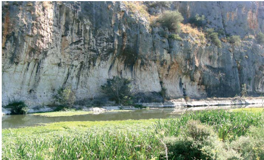
Vista panoràmica del paratge