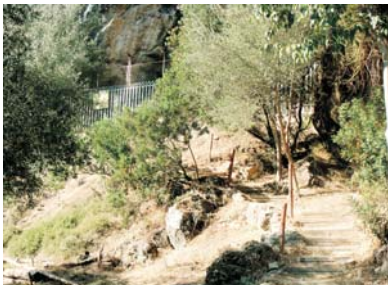
Acces Cova Negra