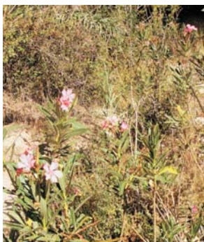
Nerium oleander (val: baladre)