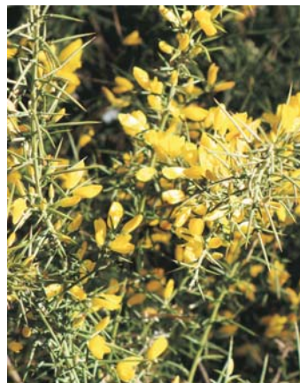
Ulex parviflorus (val: argilaga)

No s'ha de confondre amb l'arbust de l'argilaga, ja que de lluny i sense floració té un aspecte un poc semblant i si es toca es pot tindre una sorpresa no molt grata, perquè les seues fulles són dures i espinoses que ens deixaran una desagradable sensació. Les seues flors són d'un intens color groc i solen trobar-se en els mateixos llocs que el romer.