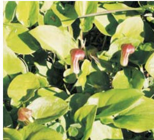
Caputxins (Arisarum vulgare)