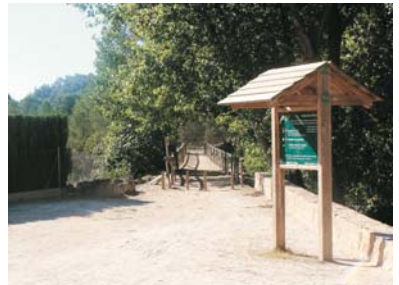
Entrada al paratge