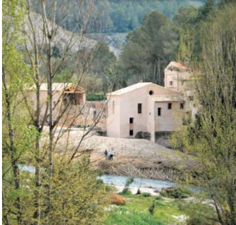
La Casa de la Llum (vista)

En pocs minuts, la senda s'obri a un gran espai, i deixa al descobert unes edificacions, conegudes com la Casa de la Llum. En dècades passades albergava una xicoteta central hidroelèctrica, que aprofitava la força de l'aigua procedent del riu Albaida. Per a això es va construir una canalització des de l'assut que hi ha aigües amunt fins a la Casa, per a travessar-la a nivell del sòl, tal com actualment podem observar gràcies a les successives fases de rehabilitació realitzades per l'Ajuntament de Xàtiva. Una vegada dins, la força de la corrent de l'aigua movia la turbina del generador, el qual convertia aquesta força fluvial en corrent elèctric, i a través de la línia elèctrica era transportada fins a la ciutat per al seu consum.