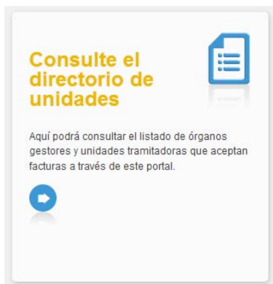
Ilustración 1: Acceso al directorio de unidades

Los organismos que están dados de alta están recogidos en el DIRECTORIO DE UNIDADES. Dicho directorio es accesible desde la home del portal de proveedores.